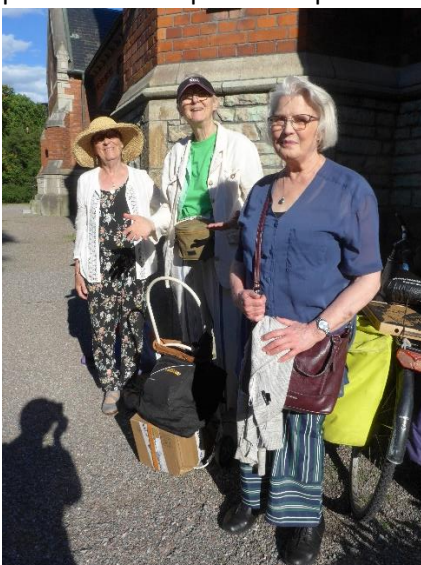
Ett glatt gäng